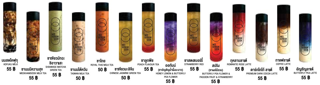
เมล็ดโคฟูคิ KOFUKU MILK 55 ฿ ชาเขียวมัทฉะ ชิฮาวะชิ SHIWAASE MATCHA GREEN TEA 55 ฿ ชาเขียวมัทฉะ ชิฮาวะชิ SHIWAASE MATCHA GREEN TEA 55 ฿ ชาเนยไต้หวัน TAIWAN MILK TEA 50 ฿ ชาไทย ROYAL THAI MILK TEA 50 ฿ ชาเขียวมะลิจีน CHINESE JASMINE GREEN TEA 50 ฿ ชาเขียวมะลิจีน (ชาเขียวกลิ่นลิ้นจี่และนางพญา) HONEY LEMON & BUTTERFLY TEA FLOWER 55 ฿ ชาผลไม้รสเปรี้ยว STRAWBERRY RED 55 ฿ สปรัง (ชาผลไม้รสเปรี้ยวและสตรอเบอร์รี่) BUTTERFLY PEA FLOWER & PASSION FRUIT & STRAWBERRY 55 ฿ กุหลาบลาเต้ ROMANTIC ROSE LATTE 55 ฿ คาร์โก้โกโก้ลาเต้ PREMIUM DARK COCOA LATTE 55 ฿ กาแฟลาเต้ COFFEE LATTE 55 ฿ บัญชียูสชาติ BUTTERFLY PEA LATTE 55 ฿